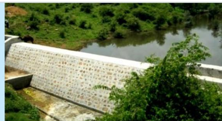
Joshiwala checkdam, Sikar, Rajasthan