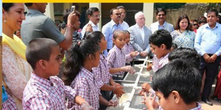
WASH in Schools project, SDMC Primary School, Sarvapriya Vihar, New Delhi