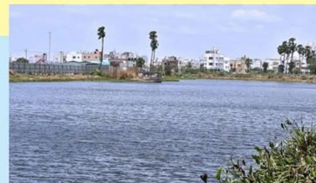
Puducherry Keni Lake, Chennai

The Government of India is implementing the Integrated Watershed Development Program, aimed at restoring ecological balance by harnessing, conserving and developing degraded natural resources. The program, which plans to cover 55 million hectares of rain-fed land by 2027, includes watershed management initiatives such as rainwater harvesting, recharging of the groundwater table, prevention of soil run-off and regeneration of natural vegetation. This enables multi-cropping and the introduction of diverse agro-based activities, which help to provide sustainable livelihoods to neighbouring communities.